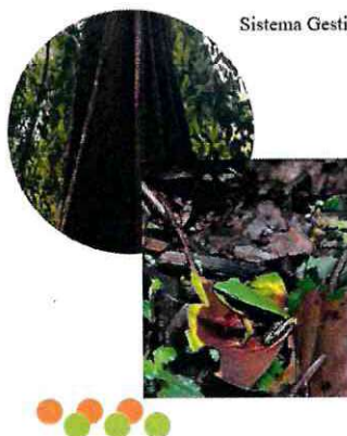
Sistema Gestión de datos del programa

A diciembre también para informarles, ya habíamos colocado 11 millones de dólares pagando 2018-2019 en los contratos que ya podían recibir segundos pagos que son privados, los públicos que ustedes saben que es SINAC y territorios indígenas, seguimos pagando 2021 porque hay contratos que hay que hacer en las modificaciones que están todavía en trámite, pero que esperamos seguir en ese proceso de pago. De esos 11 millones, 1.5 millones han sido entregados a poseedores que no habían podido recibir nunca un PSA. Esto es solo para mostrarles el sistema de Gestión de Datos del programa que es un sistema muy reconocido porque en este sistema ustedes pueden tener datos de PSA, del patrimonio, de lo que está en CREF en todo el país en este momento es para que ustedes vean que los puntos rojos son CREF, los marrones son los pueblos indígenas, los morados son FONAFIFO y los verdes es el patrimonio natural del Estado.