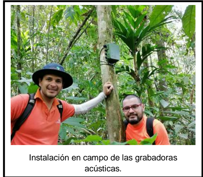
Instalación en campo de las grabadoras acústicas.

firmó un convenio de cooperación con el Instituto Internacional en Conservación y Manejo de Vida Silvestre (ICOMVIS) de la Universidad Nacional.